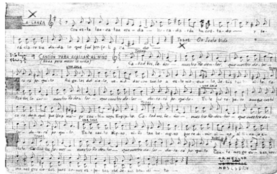
La Representación Del Nacimiento De Nuestro Señor, ,portada, y 3 páginas del original: 1, 3 y última